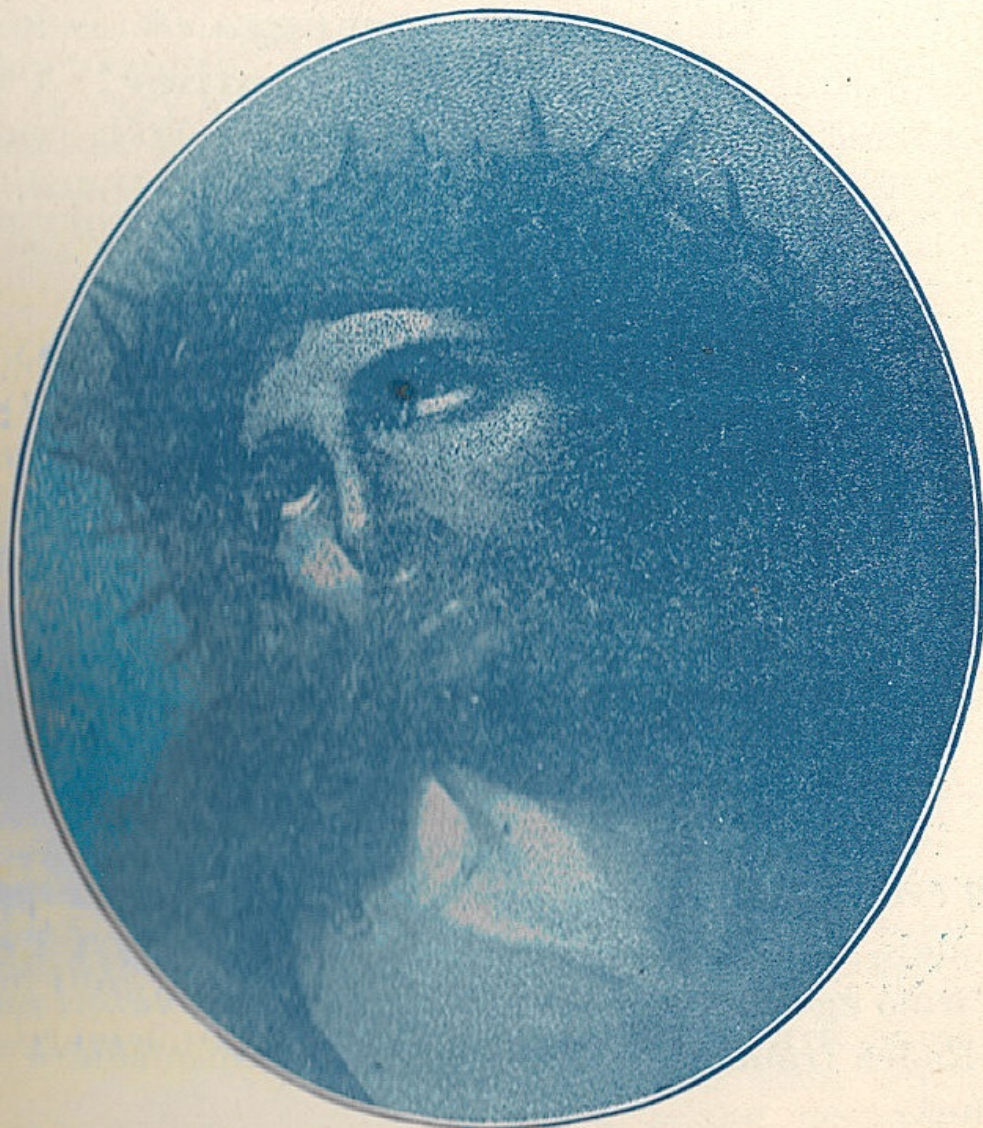
„Ime az ember!“

Hétágú korbácsról tesz említést a szent hagyomány. Juttassa ez eszünkbe azt a 7 főbűn gonoszságaiból font korbácsot, melylyel mi is vérig verjük az Úr Jézust . . . kevélységünkkel, haragunkkal . . . Mit akarsz keresztény lélek? Meddig tarthat ez? Gondold meg, hogyha majd eljön az utolsó nap — és feltámadván — elmegyünk ítéletre, ez az oszlophoz kötözött és irgalmatlanul megkorbácsolt Jézus meg fog jelenni. Meg fogja nekünk mutatni azokat a sebeket, miket a szíjjak hasítottak rajta. Mily irtózatos lesz ez, mikor az elkárhozottak feléfordulva így fog szólni az Úr: „Látjátok e sebeket! Tiértetek szenvedtem ezeket, de hiába ömlött az én vérem, ti csak tovább vagdostattok bűneitek ostorával! Hanem most, e rettenetes napon az én kezemben van az ostor: távozzatok tőlem átkozottak az örök tűzre.“