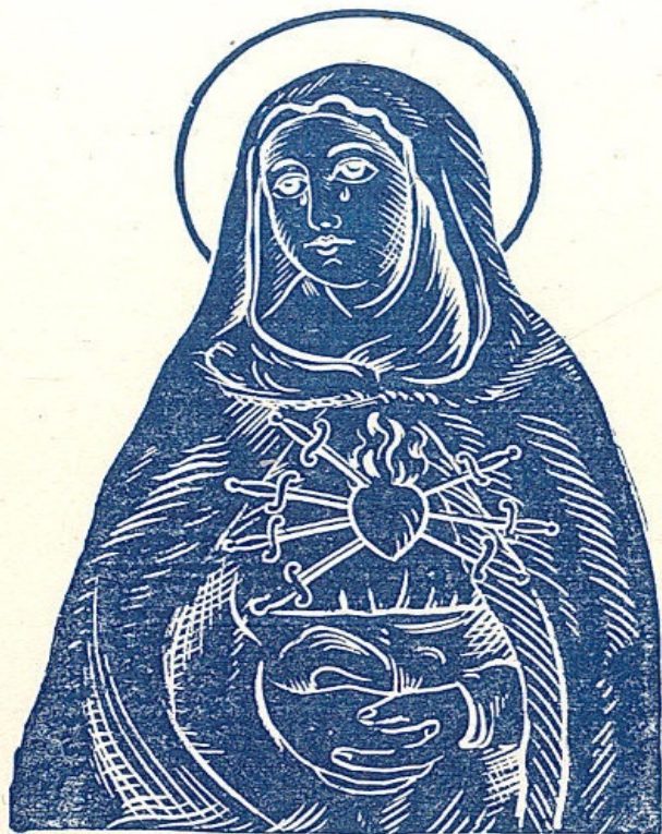
A fájdalmas Szűzanya.

bere és hosszú, kipróbált évek után arra ébredt fel, hogy ez a jó barát őt rútúl megtagadta, elhagyta, az tudni fogja, mit teszen ez a szó: Hütlenség, hálátlan-ság.